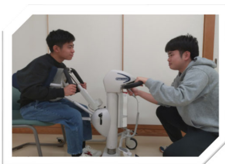
排泄サポートリフト onbu

福祉学科の特徴と魅力、学科独自の資格取得、入試や奨学金、就職状況についてもご説明します。 在学生から将来を見据えた介護系企業でのアルバイト の説明も企画しております。