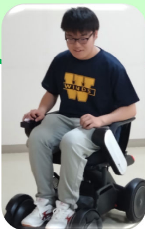
近距離モビリティ WHILL

福祉・介護分野では、ICT（情報通信技術）や介護ロボットの導入・活用により、職員の負担軽減や業務を改善・効率化する動きが始まっています。午後の模擬授業では、3種類の介護ロボットを操作して、安心・安全な新しい介護を体験しましょう。