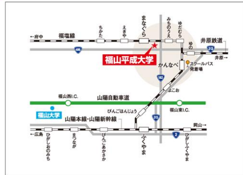
■ 道路・交通機関 (概略)