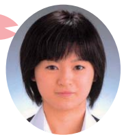
新入生のみなさん、ご入学おめでとうございます。みなさんは、大学の講義、アルバイト、そしてこれから始まる大学生活に対して、いろいろな期待を寄せているのだと思います。

最後に福山平成大学の良いところの一つは、少人数でアットホームな点があります。先生方は親身で相談にも乗ってくれますし、他のことでもわからないことや、不安な事があれば先生方や私達上級生に尋ねてみて下さい。すこしでも皆さんの学生生活が楽しくなるように、夢が叶えられるように、寄り添いたいと思っています。