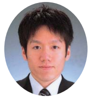
新入生の皆さん、ご入学おめでとうございます。私もそうです。