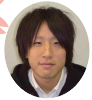
新入生のみなさん、ご入学おめでとうございます。

たしかに大学は「楽」なんですけど、時に泣きたくなることもあるんですよ。私は決して泣き虫ではないです。ただ皆さんに、諦めたくなく、何でも簡単に諦めて欲しくないからです。継続は力なり！千里の道も一歩から！ですよ。 長くなりましたが、四年間は早いからです。一日を大切に。それでは本日は本当におめでとうございます。