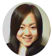
新入生の皆さん、ご入学おめでとうございます。みなさんは、今、どのような思いで、福山平成大学の門をくぐったのでしょうか。わくわくしている人、不安な人、さまざまだと思います。

小学校の体育実技ボランティアでは、教師と同じ立場に立たせていただきました。これらの経験から将来は教師になりたいと思います。今は夢を実現するために勉強に励んでいます。