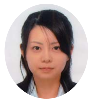
新入生のみなさん、ご入学おめでとうございます。みなさんは今、おめでとうとは裏腹に不安や期待でいっぱいのことだと思います。

大学は勉強をする場であると同時に、人間形成の場でもあります。ぜひ、みなさんにはこの4年間でたくさんの人間関係を築いていただきたいと思っています。先輩からアドバイスをしていただくことや、友人と過ごす楽しい時間、切磋琢磨する時間は、今後の人生のかけがえのない財産になるはずです。みなさんが充実した大学生生活を過ごせるよう、応援しています。一緒に頑張りましょう。