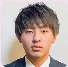
健康スポーツ科学科 (3年次生)

こども学科では、座学だけでなく自分で実践し学ぶ授業 がたくさんあります。例えば、保育者として模擬保育をし たり、子どもの気持ちになって制作をしたりしながら、友達と 切磋琢磨できる最高の環境があります。何より先生方が丁 寧に指導して下さるので、入学前に抱えていた不安はき つとすぐに吹き飛びますよ。 大学では、自分で受講する科目を選択し、履修します。私 が皆さんとお会いするのは、学生リーダーとして履修登録 のお手伝いをする時かと思えます。ちょうど2年前、先輩方 が私にしてくださいったように、私も皆さんが不安なく大学 生活を始められるように手助けできたらと思っています。 是非一緒に楽しい大学生活を送りましょうね！