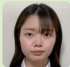
こども学科 (3年次生)

新入生の皆さんはこれから始まる4年間の大学生活に、不安や期待な ど様々な気持ちを抱えていると思います。私は現在、地元を離れて一人 暮らしをしており、アルバイトや複数のサークル活動、ボランティアにも参 加しながら学業に励んでいます。そこで出会う方々との『ご縁』を大切に、支 えてくれる人に感謝の気持ちを持って過ごしてみてください。家族や友人、 先生方、地域の方々など、その繋がりがこそ皆さんの大学4年間を充実さ せてくれるはずです。 最初は慣れないことばかりで大変だとは思いますが、胸を張って卒業で きるよう、私たちと一緒に頑張りましょう。