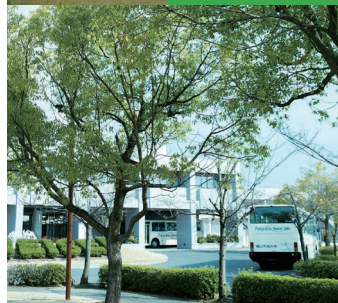
国際大会用のコート完備 第2体育館