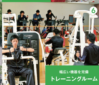
幅広い機器を完備 トレーニングルーム