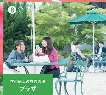
学生同士の交流の場 プラザ