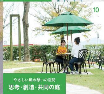
やさしい風の憩いの空間 思考・創造・共同の庭