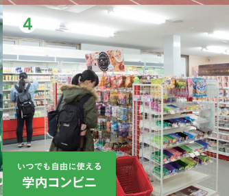
いつでも自由に使える 学内コンビニ