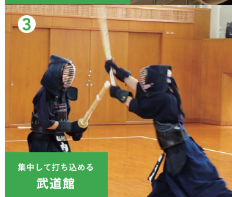
集中して打ち込める 武道館