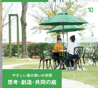
やさしい風の憩いの空間 思考・創造・共同の庭