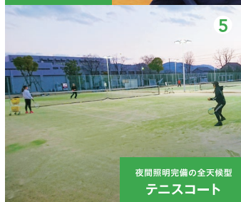
夜間照明完備の全天候型 テニスコート