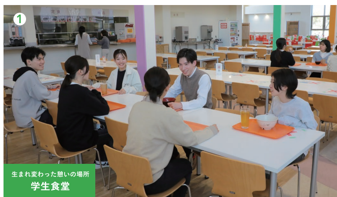
生まれ変わった憩いの場所 学生食堂

学食では、リーズナブルで ボリュームたっぷりの食事が楽しめます。 加えて、スポーツや憩いの場、IT施設などが揃い 空き時間も充実して過ごせます。