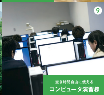
空き時間自由に使える コンピュータ演習棟