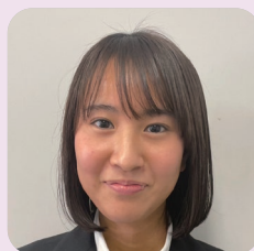
健康スポーツ科学科 (3年次生)

皆さんとは、早速新入生オリエンテーション行事で私たちとかわかることになりました。2年生から4年生で構成された学生リーダーや先生方が、楽しい催し物を準備して待っています。この機会に先輩方と仲良くなり、充実した4年間のスタートを切ってください。大学生活の中で大変に思ったり不安になったりすることもありますが、私たちも楽しい学生生活を送れるように手助け出来たらと思います。一緒に楽しい学生生活を送りましょう。