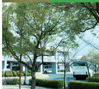
国際大会用のコート完備 第2体育館