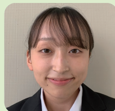
こども学科 (4年次生)

大学生活における私が考える最大の特徴は、「自由」です。学友との交流、勉強、サークルや部活、アルバイトなどを、するしないか、どれをどの程度するのかは、自分次第です。そのため、これからの4年間の大学生活を楽しかった、有意義であったと言えるものにできるかどうか、自分次第と言えます。経営学科では、消費者や流通、組織など、経営に関するさまざまな専門知識を学ぶことができます。また、講義では課題解決を通して、考える力やコミュニケーション能力を養うことができます。他にも、資格取得を目指した講義もあり、先生方も熱心に協力してくれますので、ぜひ挑戦してみてください。最後に、たった4年しかない大学生活を充実したものにするように、一緒に頑張りたいと思います。