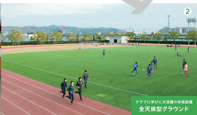
クラブに学びに大活躍の本格設備 全天候型グラウンド