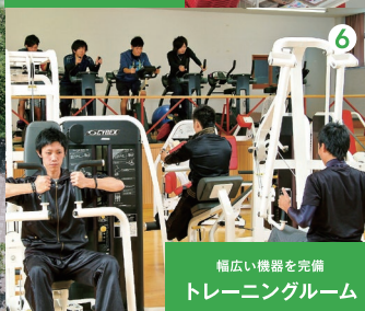
幅広い機器を完備 トレーニングルーム