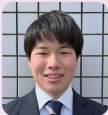
健康スポーツ科学科 (3年次生)