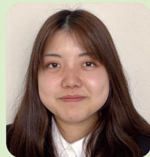
こども学科 (4年次生)

看護を学ぶということは、本当に奥が深く難しさを感じることが多いと思います。でも、皆さんのそばには、頼もしい友や先生・先輩もいます。皆さん、素敵な学生生活を送っていきましょう。