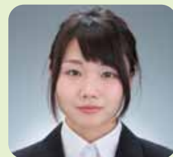
こども学科 (4年次生)

学生生活については、サークル活動などあるのですがここでは書き切ることができないので自分で体験して感じて自分なりの学生生活を切り開いてみてください。