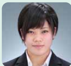
健康スポーツ科学科 (4年次生)

みなさんも、今日から看護学科というチームの一員です。共に将来に向けて、目標を持ち成長ができ、悔いを残すことなく楽しい大学生活を送りましょう。