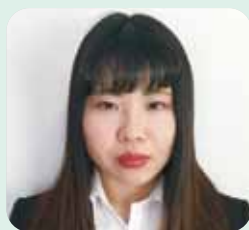
健康スポーツ科学科 (4年次生)

新入生のみなさん、入学おめでとうございませう。福祉学科では、福祉について児童、高齢者、地域などの様々な視点から学ぶことができます。そして、介護福祉士、社会福祉士、精神保健福祉士、保育士や福祉用具専門相談員などの資格取得を目指すことができます。努力次第では、社会福祉士、介護