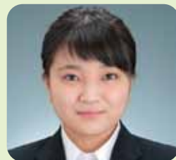
こども学科 (4年次生)

す。自分を見失わず目標に向かって更に努力し続けてください。大学生というのは立派な大人です。単位を落とすのも大学に行かないのも自己責任です。一方、まだ扶養されている身分でもあります。日々の生活は親あつてからこそ成り立っているのだと肝に命じてください。最後に人生の少し先輩からアドバイスを贈ります。「親に恩返しせよ!」です。お金と時間に余裕がある大学生活では沢山のことが出来ます。これまでなかなかしてこれなかったであろう、親孝行をしてみてください。アルバイトで稼いだお金でプレゼントを贈るなど些細なことでもいいです。大人という自覚と親への感謝の気持ちを持ち充実した大学生活を送ってください。厳しいことを言いましたが、あなたの成長を心から楽しみにしています。