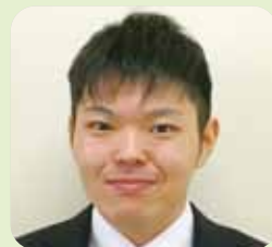
こども学科 (4年次生)

新入生の皆さん、入学おめでとうございます。皆さんと出会い福山平成大学で一緒に学ぶことが出来ることを心から嬉しく思います。新しい環境に変わり期待や不安でいっぱいでしょう。大学はとても楽しいです！部活・サークルに所属するもよし、資格取得や勉学に励むもよし、友達を作って遊ぶもよし、大学生活を楽しんでください。 さて、大学の4年間は長いようでとても短いです。そんな4年間で過ごす新入生の皆さんに一つアドバイスさせてください。それは「挑戦せよ！」です。部活動でも、学内イベントでも、アルバイトでも、親孝行でも、趣味でもなんでもいいです。何かに挑戦してみてください。大学での挑戦は4年後あなたの大きな財産になっています。私はサークル(メディア研究会)を作ったりしました。私達のサークルへの入部お待ちしております！何か自分なりに挑戦し、福山平成大学に入学してよかったなと思う充実した大学生活を送ってください。