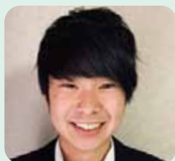
健康スポーツ科学科 (4年次生)

新入生の皆さん、入学おめでとうございます。福祉学科は、社会福祉コースと介護福祉コースのどちらかを選択します。そして、4年間で地域福祉、児童福祉、高齢者福祉、障害者福祉などを学ぶことができる学科です。資格は、介護福祉士、社会福祉士、精神保健福祉士、保育士