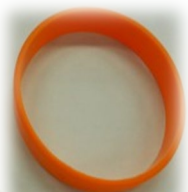
オレンジリング (ハンドリング)